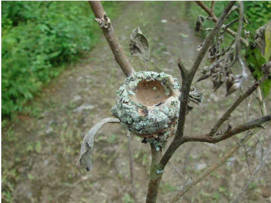
FIG. 2. El nido de la Estrellita esmeraldeña ( Chaetocercus berlepschi ) en un arbolito de Tessaria integrifolia (Asteraceae) (por Berton Harris).