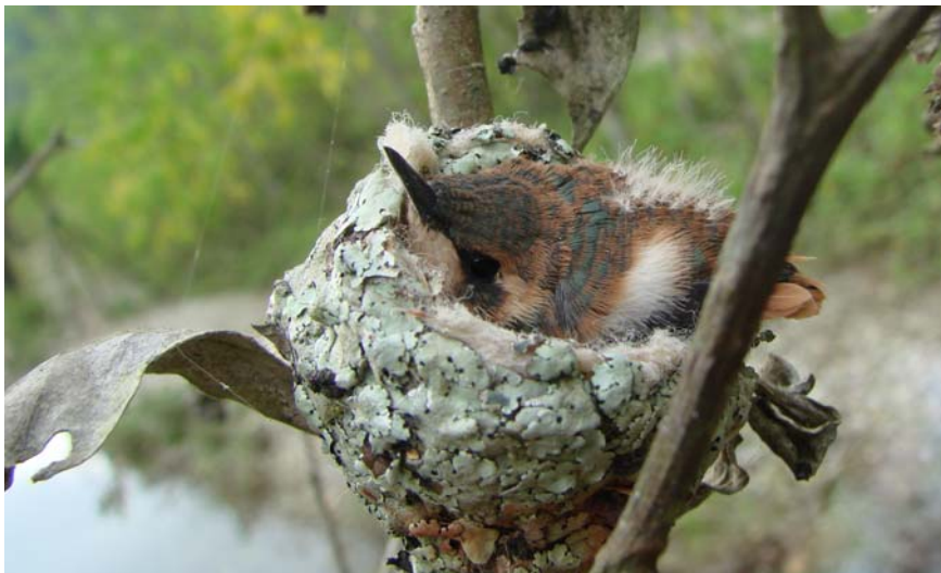
FIG. 3. Pichón hembra de Estrellita esmeraldeña ( Chaetocercus berlepschi ) aproximadamente en día 14 (por Berton Harris).